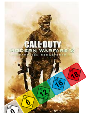
Bilder zu den Themenbereichen: Social Media, Cybergrooming, Altersbegrenzung von Computerspielen